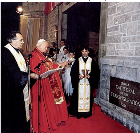
pápež Ján Pavol II. vykonáva posviacku katedrály Premenenia Pána (1984)