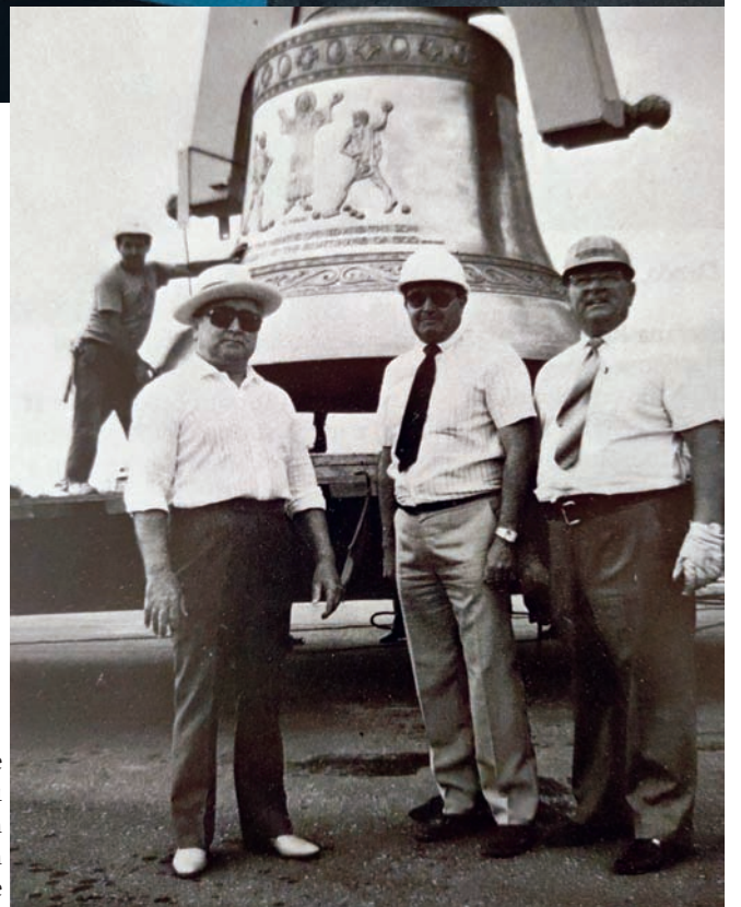
zvon pre katedrálu Premenenia Pána v Unionville