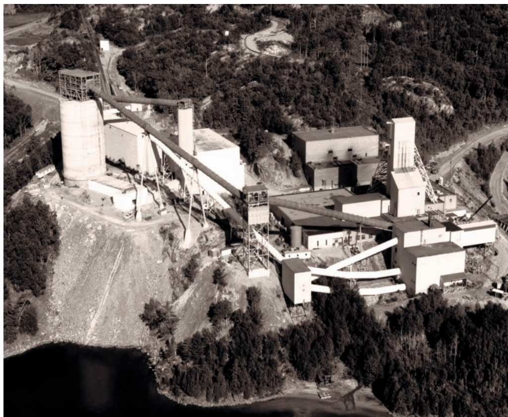
Uránová baňa v Elliot Lake